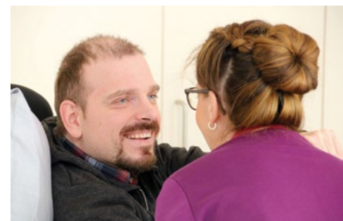
Patient und Ärztin im MZEB Würzburg

Ein gutes Gesundheitssystem ermöglicht allen den Zugang zu den medizinischen und therapeutischen Leistungen, die sie benötigen. Für viele Menschen mit Behinderungen gilt dies leider noch nicht. In der UN-Behindertenrechtskonvention (UN-BRK) verpflichten sich die Vertragsstaaten in Artikel 25, Menschen mit Behinderungen eine ortsnahe gesundheitliche Versorgung in derselben Bandbreite und von derselben Qualität zu garantieren wie Menschen ohne Behinderungen. Zusätzlich sollen sie die Leistungen der gesundheitlichen Versorgung erhalten, die sie wegen ihrer Behinderung benötigen.